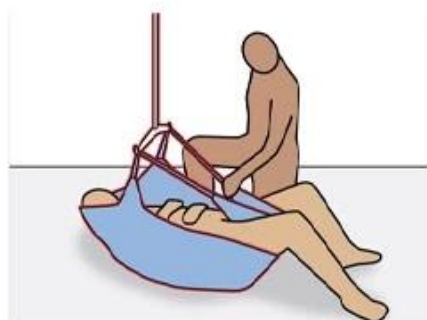
Подъем с пола

Теперь наша продукция соответствует стандартам ISO9001, ISO13485, ISO10535, CE, SGS, UKCA и т. д.